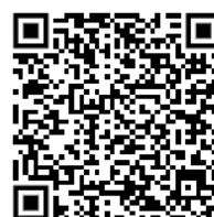
Convention Collective des Commissaires de justice et sociétés de ventes volontaires

Vous pouvez consulter celle-ci en scannant le QR code ci-contre.